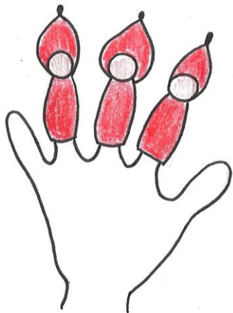
Sveikatukus piešė Indrė